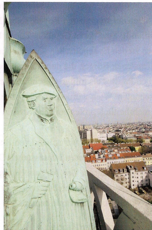
Lutherrelief am Kirchturm