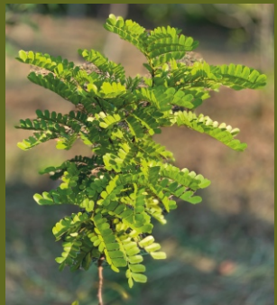
Fernambukbaum, ca. 6 Monate alt

Dieser Vortrag gibt Einblicke in den seltenen Beruf des Bogenmachers und führt uns in eine faszinierende Gegend Südamerikas.