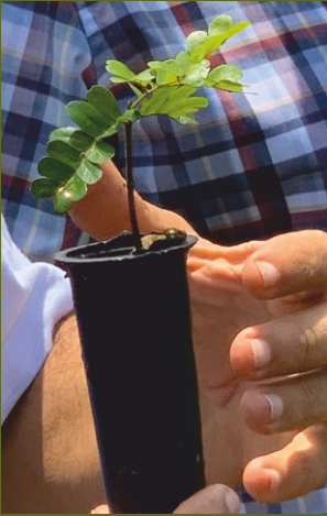
Jungpflanze, ca. 8 Wochen alt