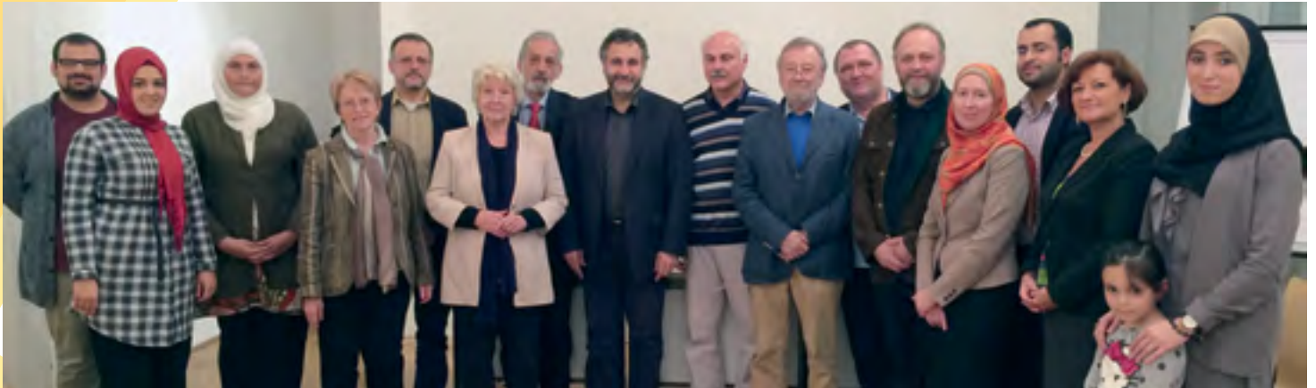
Gemeinsam Frieden stiften: Mitglieder der ersten Generalversammlung der Plattform „Christen und Muslime“ nach der Vereinsgründung am 23. September 2014 im Otto-Mauer-Zentrum im 9. Bezirk.

Gesichter der „Plattform Christen und Muslime“