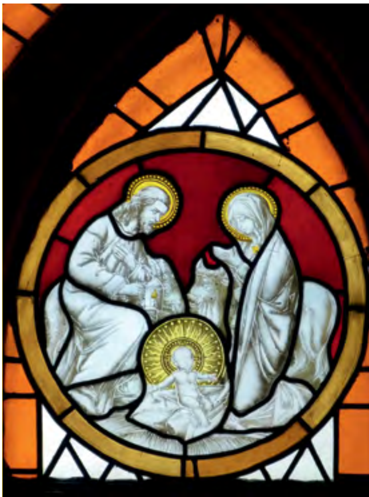
Zu Weihnachten wird Gott in Jesus Christus Mensch und zeigt sein Gesicht als kleines, neugeborenes Kind – in einem Stall zu Bethlehem mit seinen Eltern Josef und Maria. Ein wunderbares Motiv für Kirchenfenster weltweit.